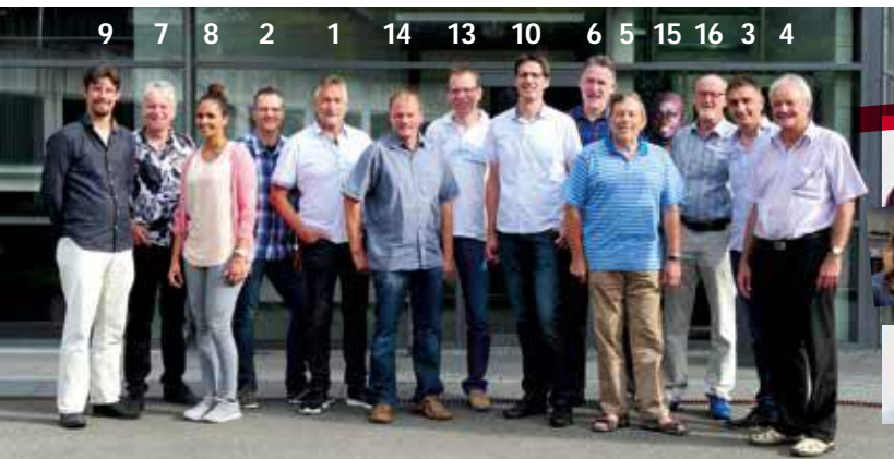
Neu im Team 2016/2017

Die Berechnung bezieht sich auf Finanzspenden; die zusätzlichen geschätzten CHF 5 770 000.- an Sachspenden sind nicht berücksichtigt.